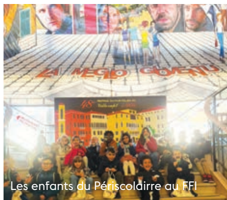
Les enfants du Périscolaire au FFI