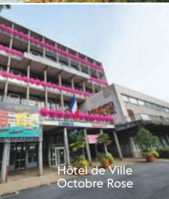
Hôtel de Ville Octobre Rose