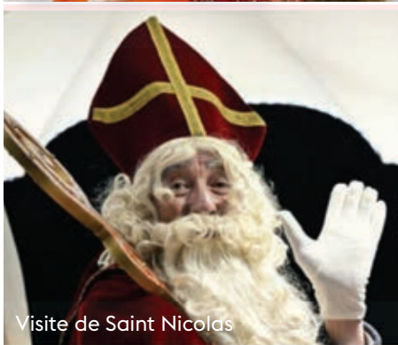
Visite de Saint Nicolas