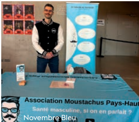
Association Moustachus Pays-Haut Santé masculine, si on en parlait ? Novembre Bleu