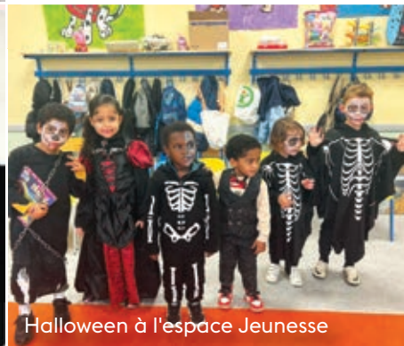
Halloween à l'espace Jeunesse