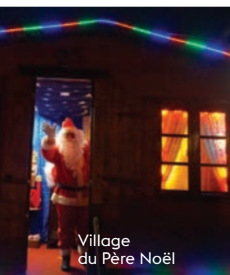
Village du Père Noël