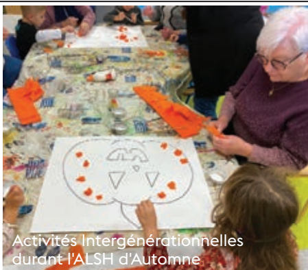
Activités Intergénérationnelles durant l'ALSH d'Automne