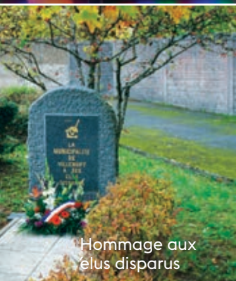
Hommage aux elus disparus