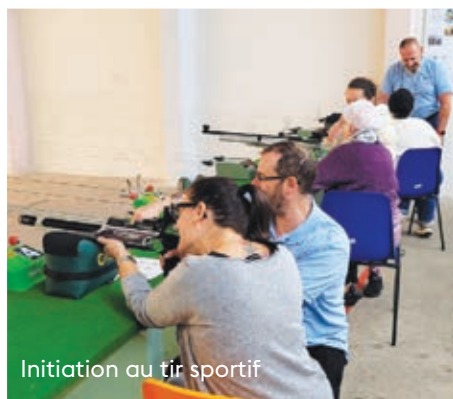
Initiation au tir sportif