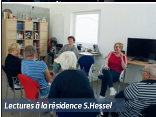
Lectures à la résidence S.Hessel