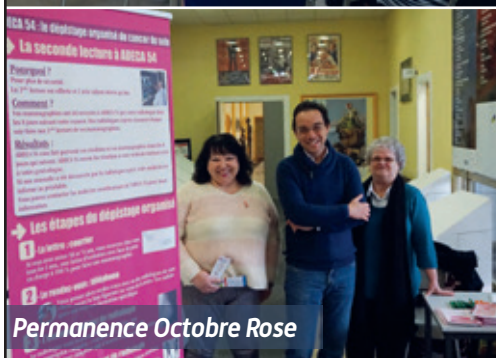
Permanence Octobre Rose