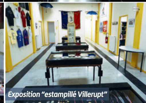
Exposition "estampillé Villerupt"