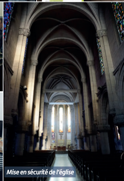
Mise en sécurité de l'église