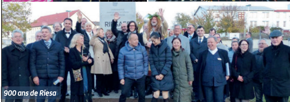
900 ans de Riesa