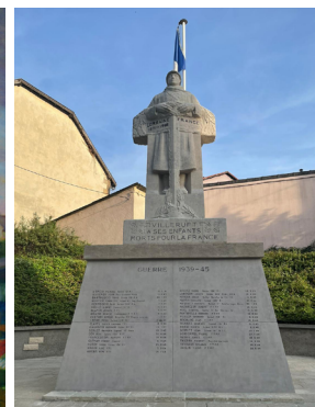
Aérogommage du Monument aux Morts