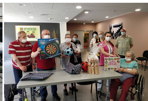
Cadeaux du Club des 6 Pour l'Ehpad Michel Dinet