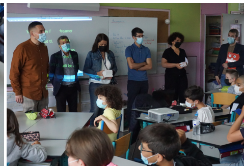
et remise des cadeaux pour l'opération fête 2022