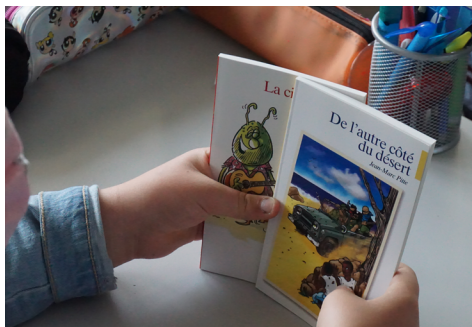
Distribution des livres dans les écoles