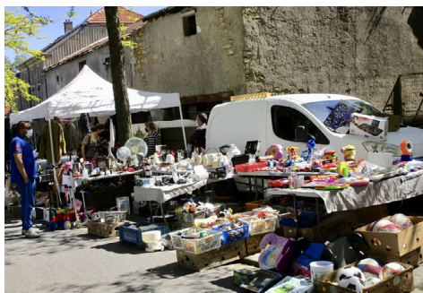
Brocante du handball