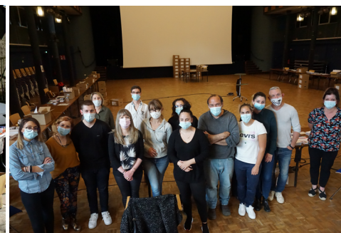
mise sous pli élections