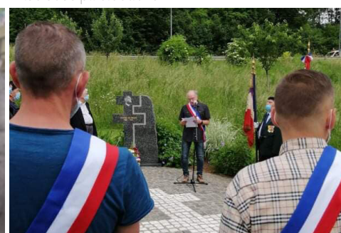
Commémoration Appel du 18 Juin 1940

Directeur de la publication : Pierrick SPIZAK - Coordination et suivi : Service Communication Impression : Lorraine Graphic • Conception et réalisation : MYT Création - Mexy (54) tirage : 4 400 exemplaires • dépôt légal n° _____