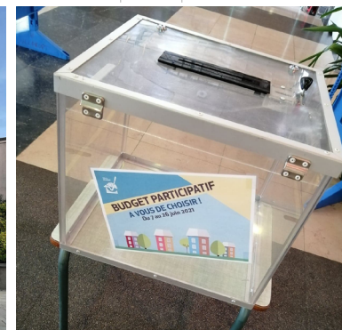
vote du budget participatif