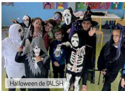
Halloween de l'ALSH