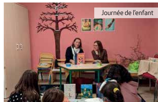
Journée de l'enfant