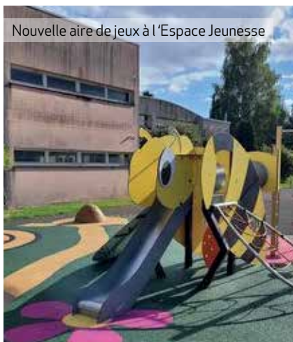
Nouvelle aire de jeux à l'Espace Jeunesse