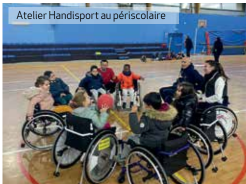
Atelier Handisport au périscolaire

Directeur de la publication : Pierrick SPIZAK Coordination et suivi : Service Communication Impression : Lorraine Graphic Conception et réalisation : PMG Tirage : 4 400 exemplaires Dépôt légal Janvier 2023