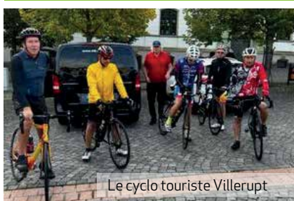
Le cyclo touriste Villerupt