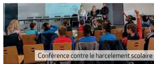
Conférence contre le harcèlement scolaire