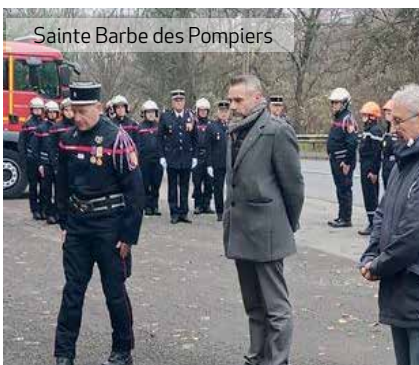
Sainte Barbe des Pompiers